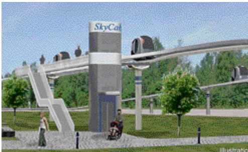
PILOTBANA FÖR SPÅRTAXI. Alla har sin egen vagn och passageraren åker dit han eller hon vill utan onödiga stopp på vägen. ARKITEKT FREDRIK BERNHARDT